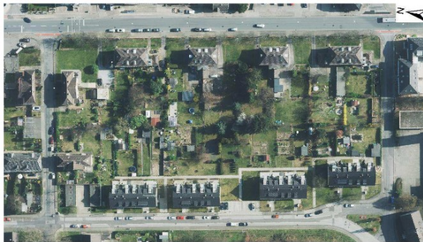
Luftbildausschnitt 2014 Richrather Straße / Martinstraße / Paulstraße

der Start des Planungsprozesses zur Bebauung der Freifläche zwischen Steinrausch / Richrather Straße / In den Griesen / Martinstraße (Bebauungsplan „I-112 Steinrausch / Martinstraße“) ist beschlossen: ein erster Projektvorschlag sieht vier neue Gebäude inmitten der aktuellen Freifläche mit den Gärten vor (als blaue Flächen in der Skizze rechts zu dargestellt).